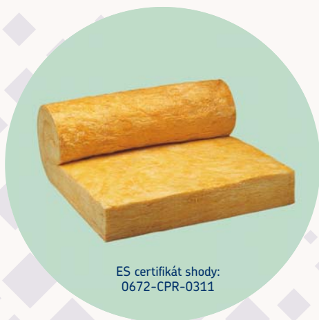
ES certifikát shody: 0672-CPR-0311